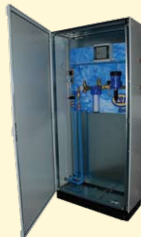
Centralina trattamento odori